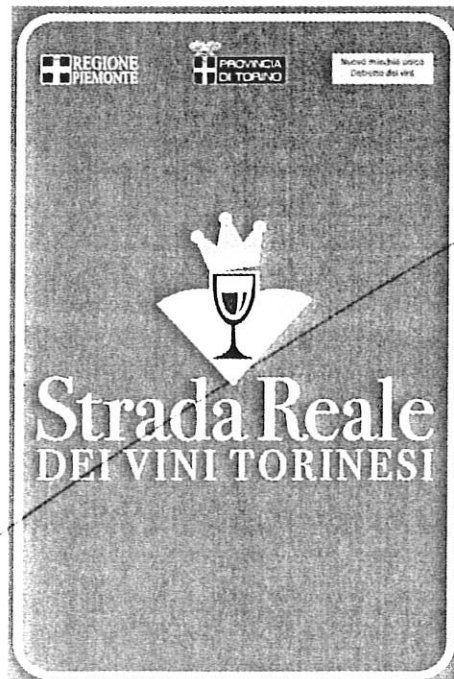
Cartelli informativi interni 60x90 cm