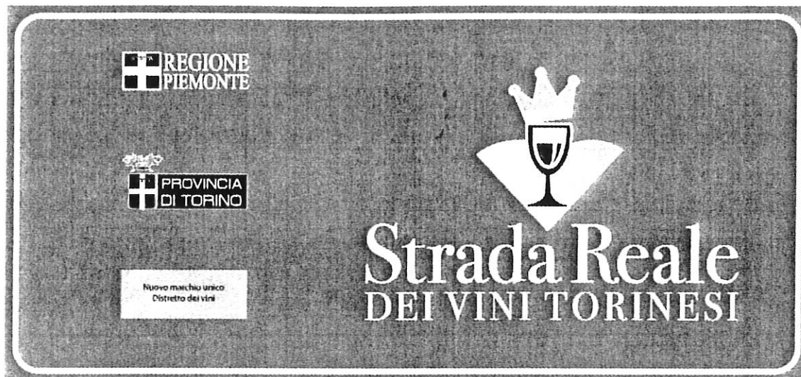
Cartelli informativi perimetrali Portali Identificativo dei Comuni 150x70 cm