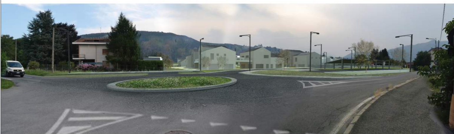
VISTA E FOTOINSERIMENTO DA VIA SANT'AGOSTINO