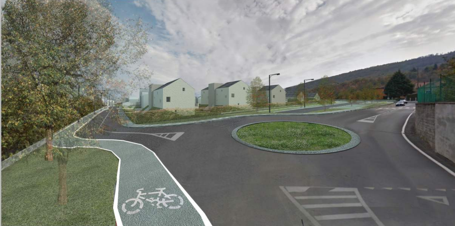
VISTA E FOTOINSERIMENTO DA VIA BENETTI