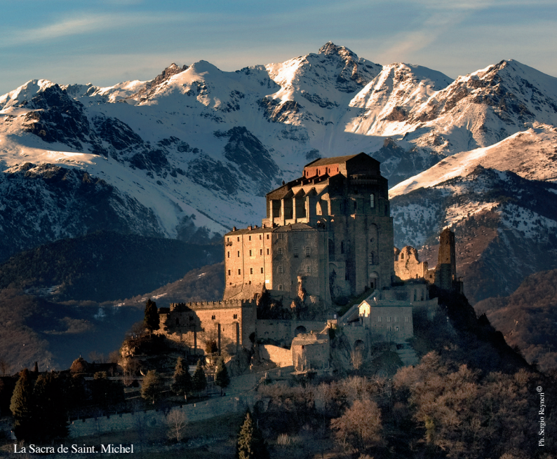
La Sacra de Saint. Michel