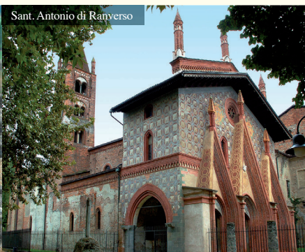
Sant. Antonio di Ranverso