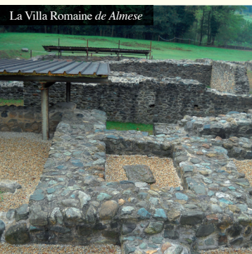
La Villa Romaine de Almesè

Avigliana est au coeur d'un vaste territoire disposant d'un riche patrimoine culturel et naturel de toute beauté. La Sacra de Saint Michel, Saint Antoine de Ranverso, La Villa Romaine de Almesè, représentent seulement une partie des sites touristiques à visiter durant votre séjour. Venez découvrir la Valle de Susa et ses trésors. Pour toutes informations consultez: www.vallesusa-tesori.it